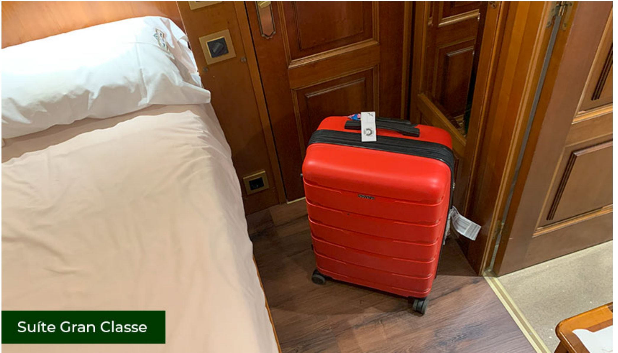
Suíte Gran Classe