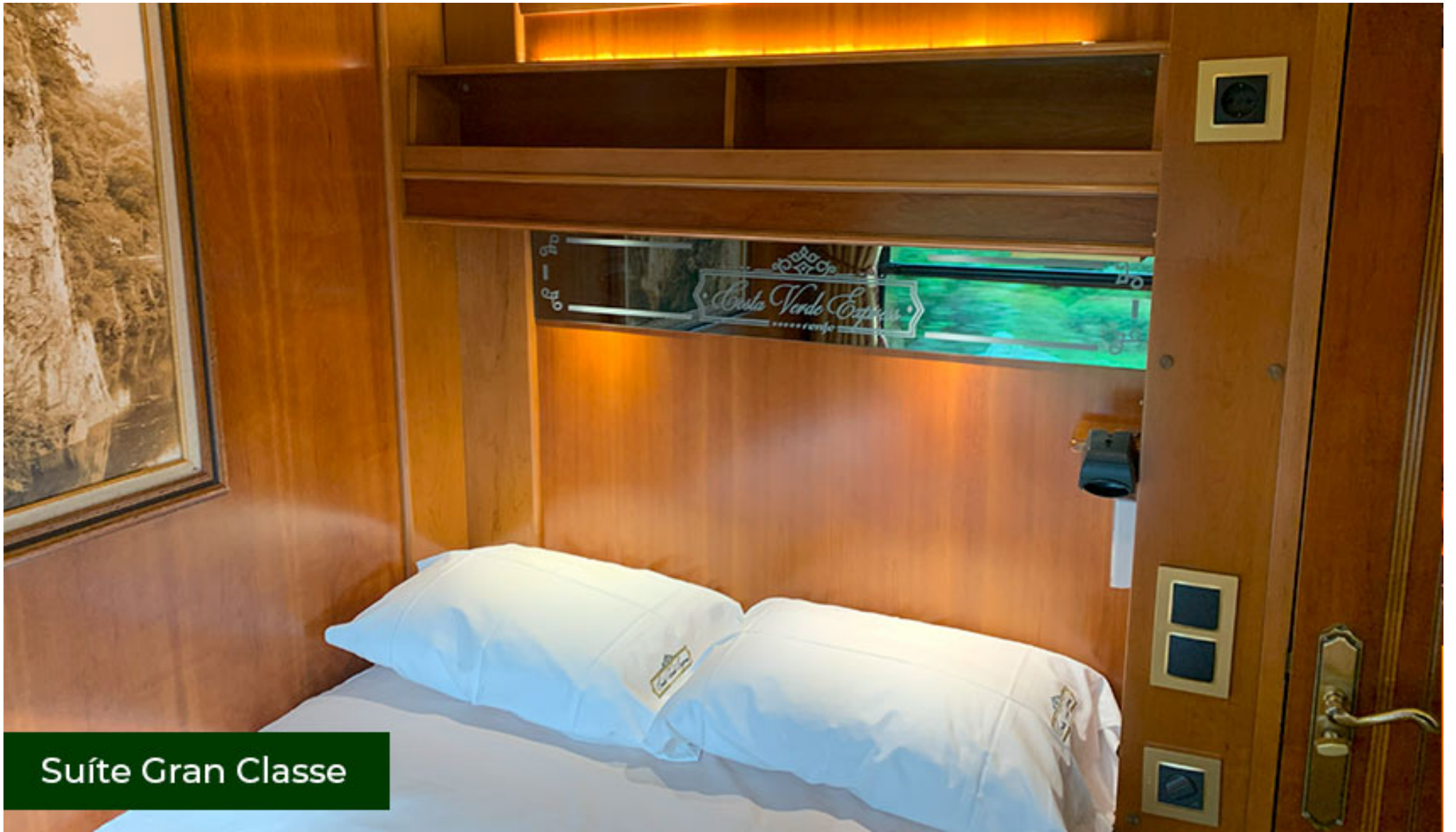
Suíte Gran Classe