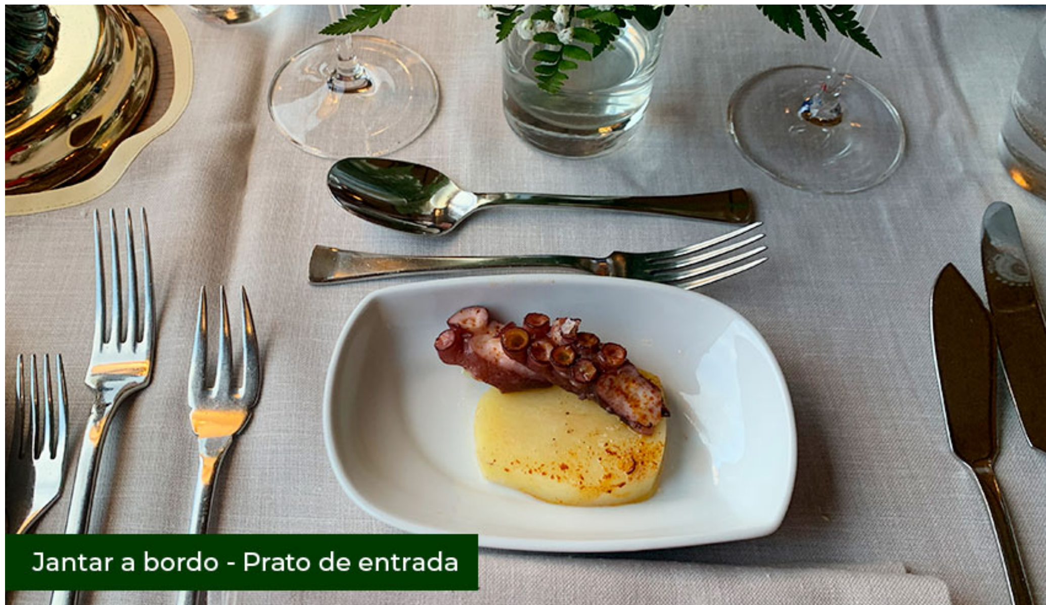
Jantar a bordo - Prato de entrada