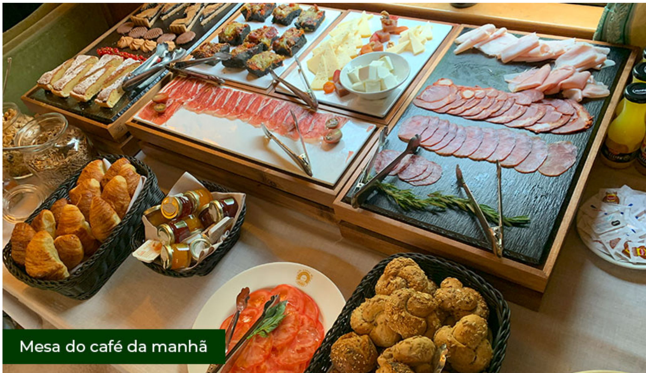
Mesa do café da manhã