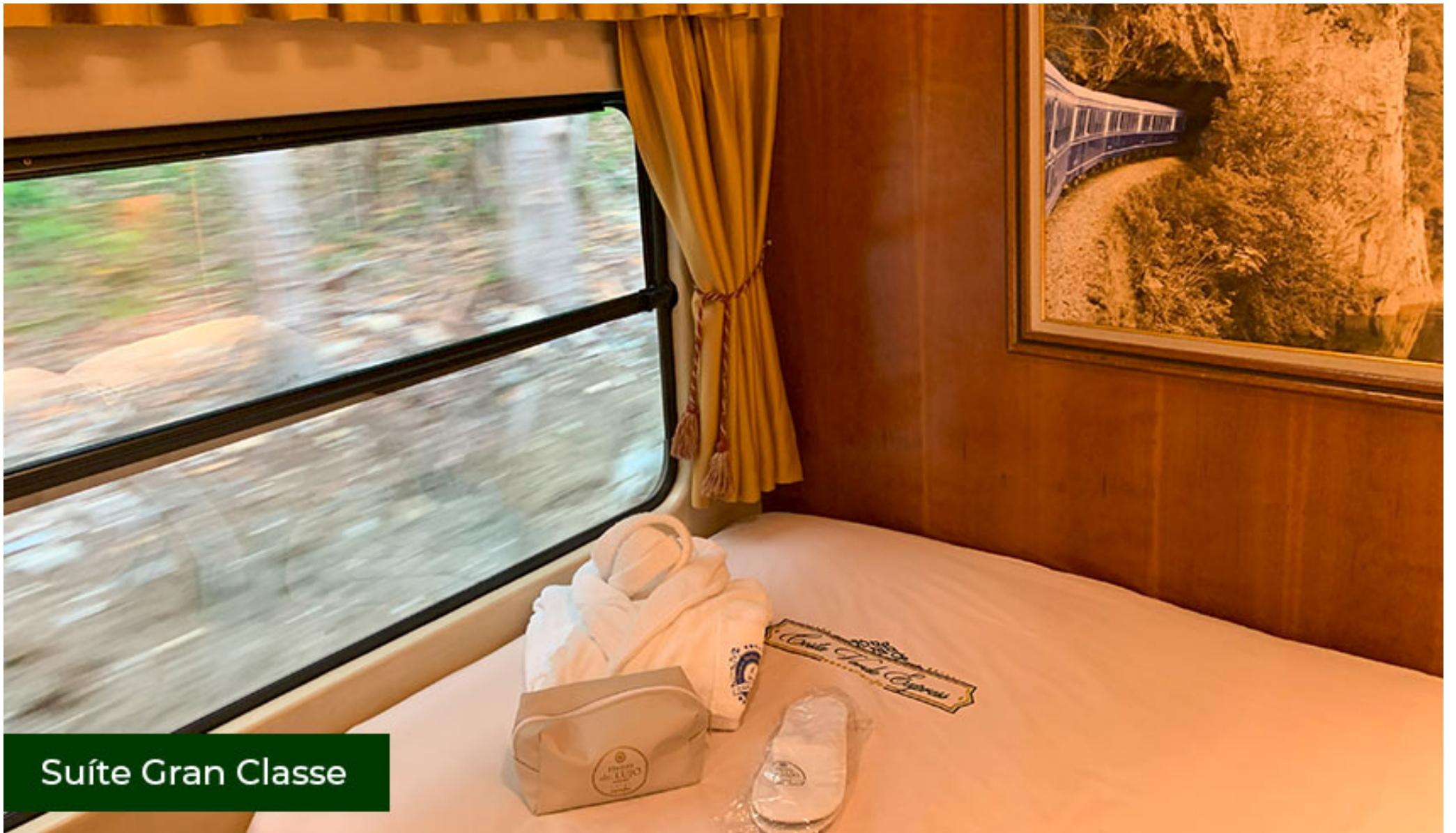
Suíte Gran Classe