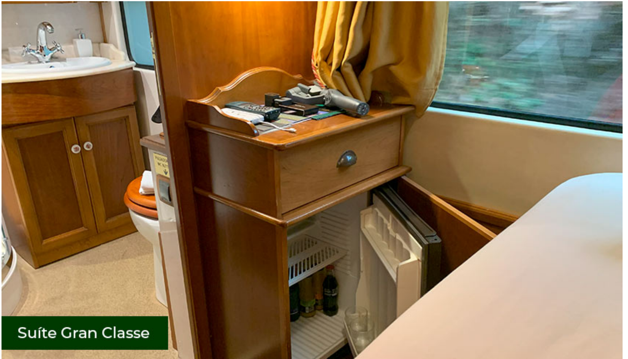
Suíte Gran Classe