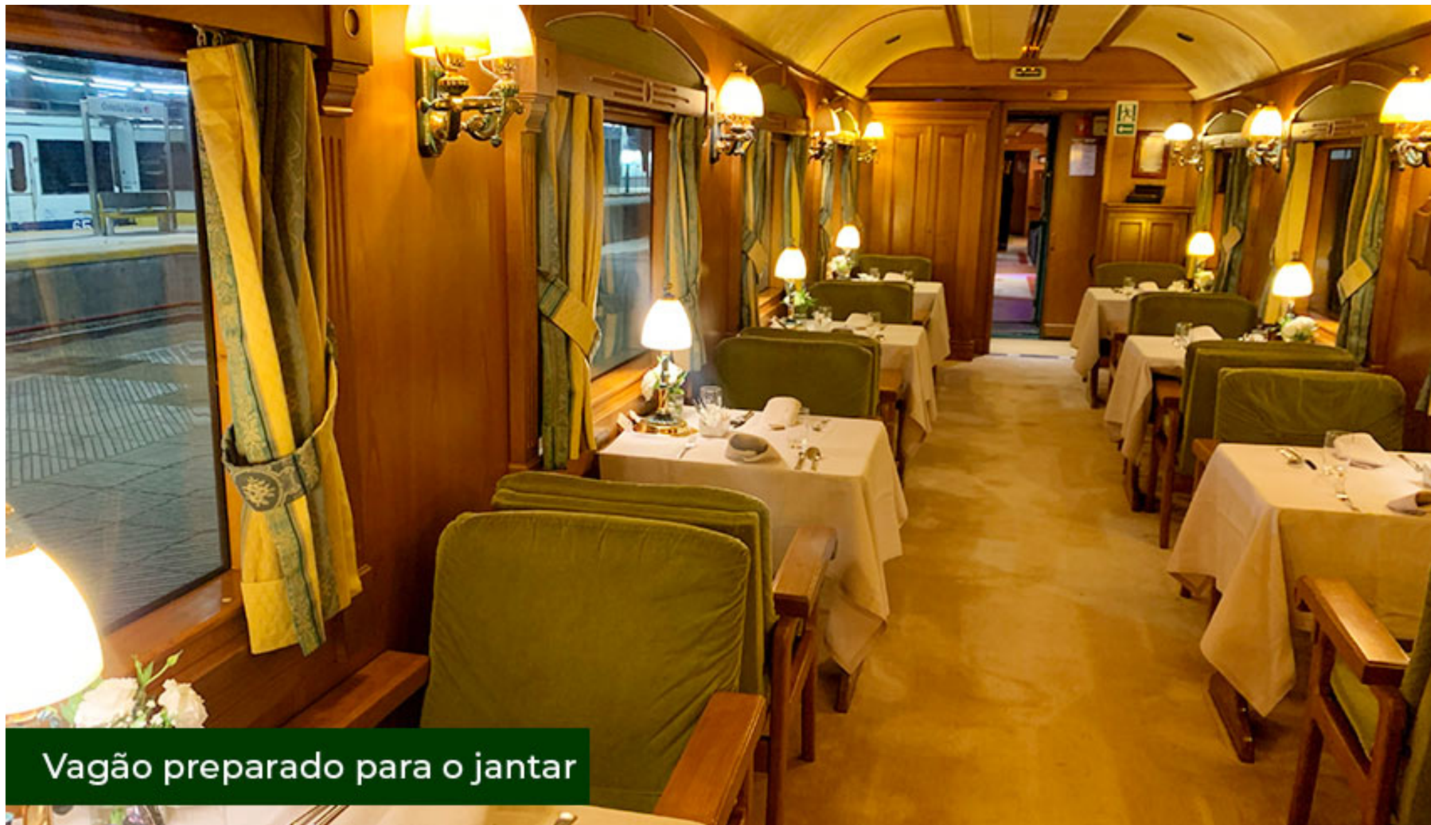
Vagão preparado para o jantar